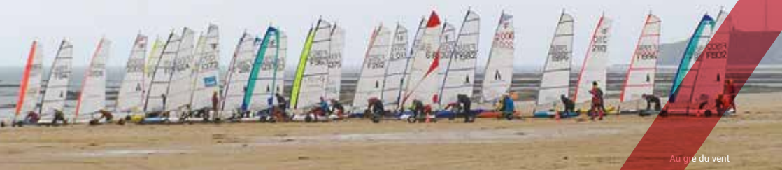
Au gré du vent