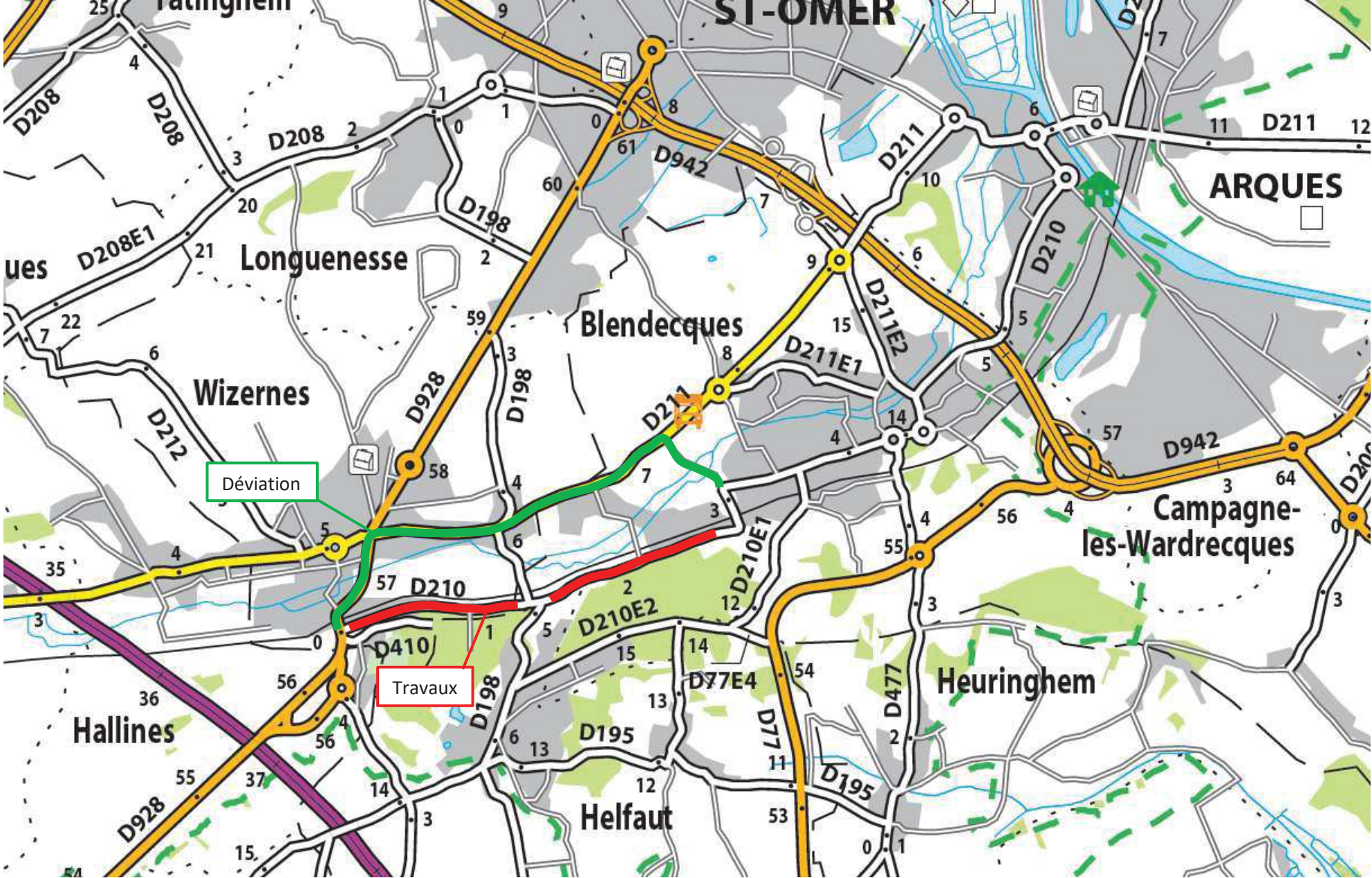
Déviation RD 210 BLENDECQUES-HELFAUT-WIZERNES AU23390AT