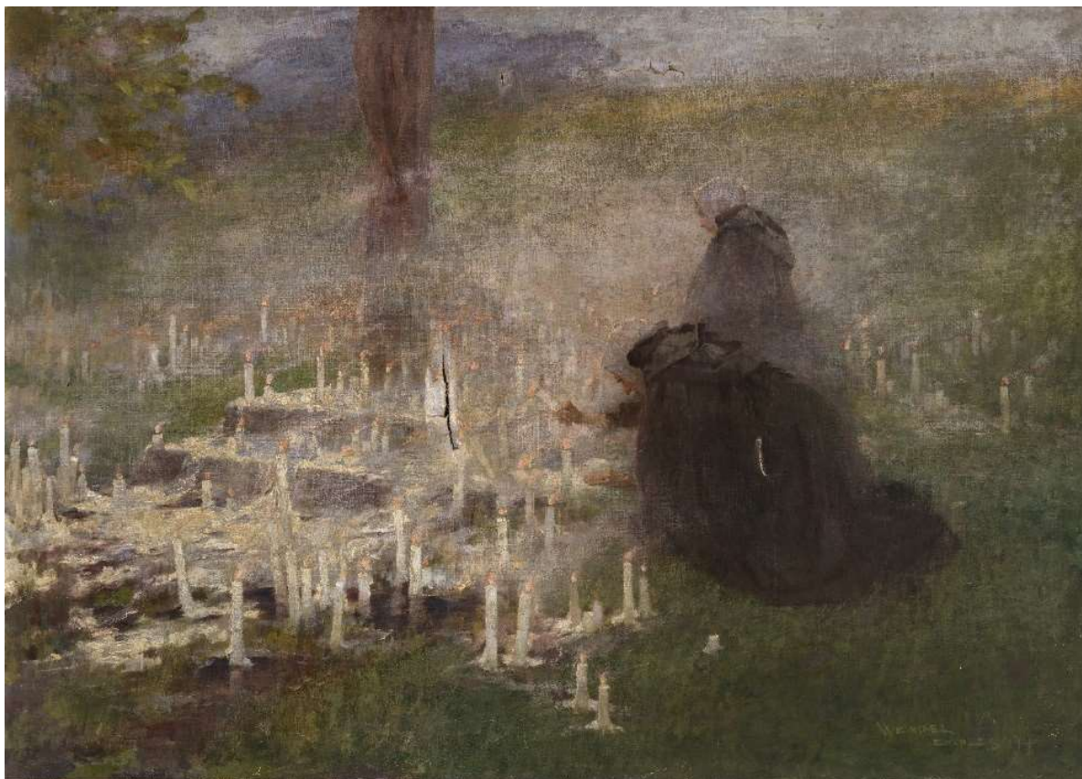
Jules WENGEL, Les Cierges de Saint-Josse , 1894