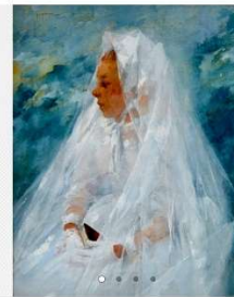
Jules WENGEL, Communiante , 1894, coll.part

2600560. JULES WENGEL (1865–1934). Portrait of girl in bridal veil, watercolour, signed Jules Wengel Etaples 1894.