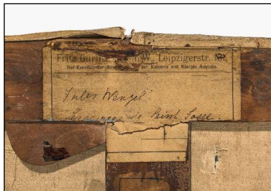
Revers de la toile Les Cierges de Saint Josse de WENGEL