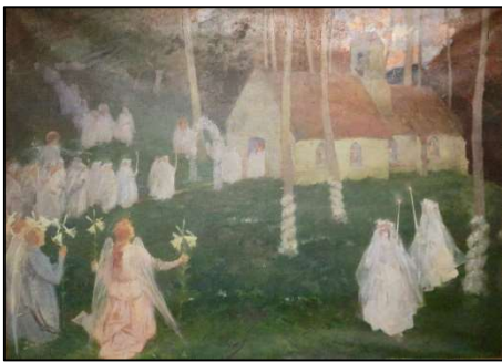
Jules WENGEL, Les Anges de la première communion , Musée Rodière de Montreuil-sur-Mer

Jules WENGEL maîtrise parfaitement les effets de la lumière et de la fumée par de multiples touches de couleurs. En véritable maître du portrait, il saisit les profils des pieuses femmes qui sont très réalistes. On peut rapprocher cette œuvre de deux autres œuvres de Jules WENGEL peintes dans la même veine symboliste : Les Anges de la Première communion et de La Communiante .